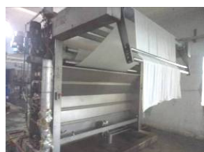
棉针织物冷漂前处理生产线