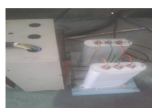
空压机添补偿电容