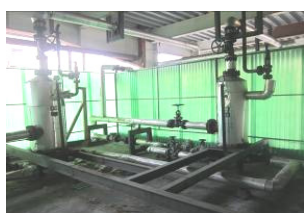
蒸汽冷凝水回用储水罐