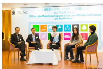
共创可持续发展的未来