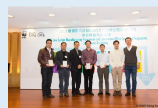
翠丰和供应商合照

翠丰亚洲有限公司身体力行，连续四年获得 LOOP 标签认证，并且与供应商分享低碳理念，已有 26 间供应商参与 LCMP，其中 22 间获得 LCMP 标签认证，“宁波大叶园林设备有限公司”及“宝时得机械(中国)有限公司”更取得白金标签，成绩令人鼓舞。