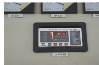
无功功率自动补偿器