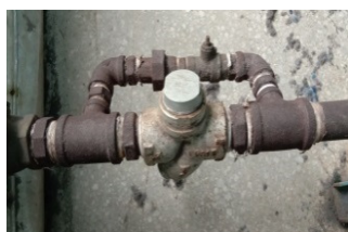
烘干机旧式疏水阀