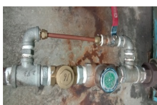
烘干机新式疏水阀