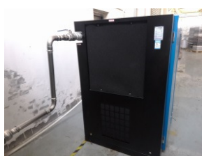
永磁变频螺杆空压机