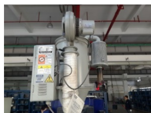
干燥桶热风回收 (改善前)