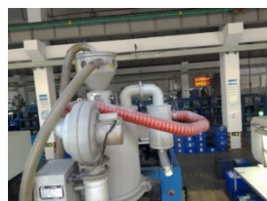
干燥桶热风回收 (改善后) - 红色管子