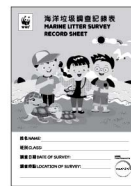
海洋垃圾調查 記錄表